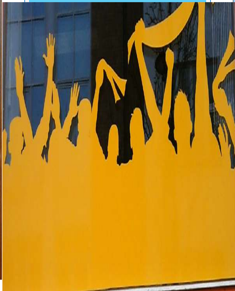
Výlep na sklo VS